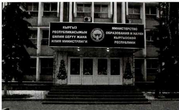
Кыргыз Республикасынын Билим берүү жана илим министрлиги.

Алар өзүнө негизги билим берүү программаларынын чегин, бүтүрүүчүлөрдүн сапатына коюлган базалык талаптарды, окуучуларга жол бериле турган окуу талаптарынын чегин камтыйт.