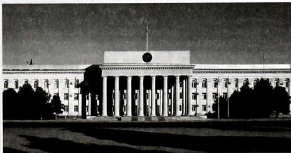
Кыргыз Республикасынын Өкмөт Үйүнүн имараты.

Эгерде жогоруда көрсөтүлгөн мөөнөт бүткөнгө чейин Жогорку Кенеш программаны бекитпесе, Өкмөттүн түзүмүн