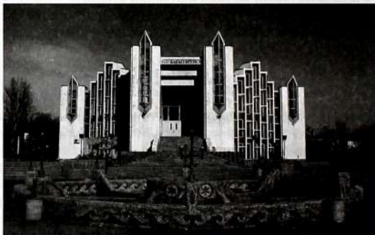
Бишкек шаарындагы Бакыт үйү.

Үй-бүлөнүн коом үчүн, мамлекет үчүн мааниси чон. Үй-бүлө канчалык бекем болсо, балдарга тарбияны жакшы берсе, коом дагы бекем, туруктуу болуп, натыйжада мамлекеттин өнүгүп-өсүшүнө оң таасирин тийгизет. Республикабыздын