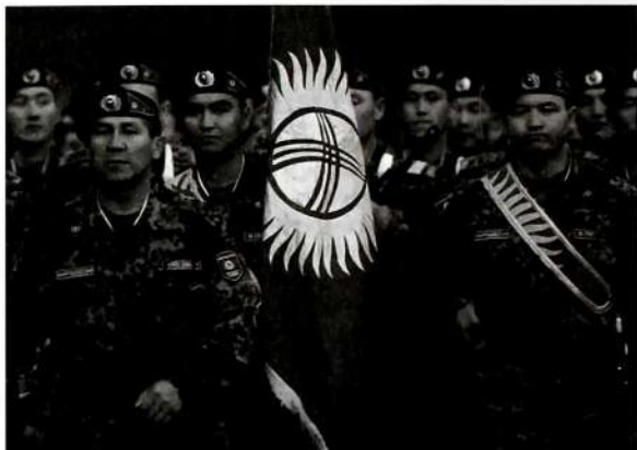
Мекенди коргоо – жарандардын ыйык милдети.

Медициналык же башка атайын даярдыгы бар 19 жаштан 40 жашка чейинки кыз-келиндер тынчтык мезгилинде аскердик каттоого алынышып, аскердик жыйындарга тартылышы мүмкүн. Согуш мезгилинде кыз-келиндер республиканын Президентинин чечими менен Куралдуу Күчтөрдүн көмөкчү жана атайын бөлүктөрүнө чакырылышы мүмкүн.