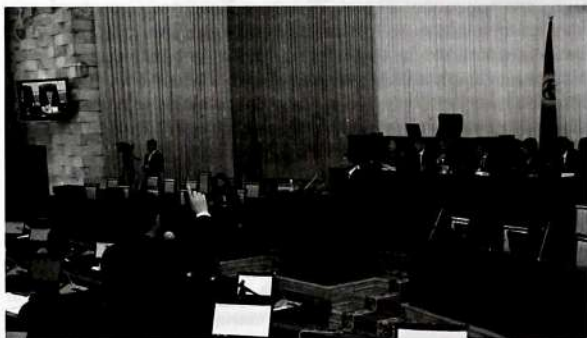
Жогорку Кеңештин депутаттарынын жыйыны.

1. Мыйзам чыгаруу иши. Кыргыз Республикасынын Конституциясынын 79-беренесине ылайык, мыйзам чыгаруу демилгесине: 10 миң шайлоочу (элдик демилге), Жогорку Кеңештин депутаттары, Кыргыз Республикасынын Өкмөтү ээ. Жогоруда көрсөтүлгөн сандагы калк, органдар жана кызмат адамдары гана тийиштүү мыйзам долбоорун Жогорку Кеңештин кароосуна коё алышат.