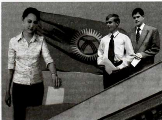
18 жашка чыккан жаран шайлоо укугуна ээ.

Ушул конституциялык жобону ишке ашырууга арналган, шайлоо укугунун булагы болуп эсептелген – Кыргыз Республикасындагы Шайлоо жөнүндөгү кодекс кабыл алынган. Бул Кодексте мурда чачыранды болгон шайлоо тууралуу мыйзам актылары бириктирилип, бирдиктүү тутумга келтирилген. Натыйжада Кодекс жарандардын шайлоо укук-