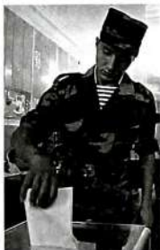
Активдүү шайлоо учуру.

рына шайлоого жана шайланууга болгон конституциялык укуктарын айтабыз.