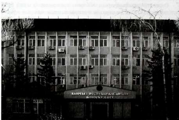
Кыргыз Республикасынын Жогорку сотунун имараты.

Бийликти бөлүү принцибине ылайык Кыргыз Республикасында көз карандысыз сот бийлиги бар. Соттордун негизги милдети – бул сот адилеттигин жүзөгө ашыруу.