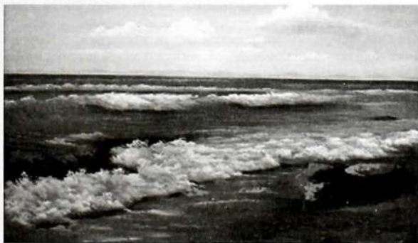
Кыргыз бермети Ысык-Көл.

5. Суу укугу. Адамдардын жашоосу үчүн суунун кандай мааниси бар экендигин билесинер. Барган сайын жер бетинде суулар азайып, деңиздер соолуп, булактар кургап жатат. Бул – адамдардын сууну эсепсиз, ысырап пайдалангандыгы-