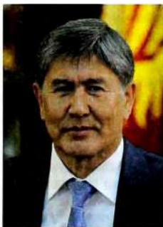
Алмазбек Шаршенович Атамбаев Кыргыз Республикасынын Президенти

2011-жылкы президенттик шайлоодо жеңип, 2011-жылдын 1-декабрынан президенттик кызматты аткарууда.