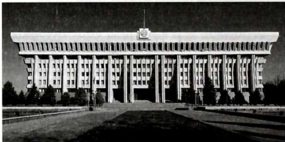
Кыргыз Республикасынын Президентинин жана Жогорку Кеңешинин имараты.

Кыргыз Республикасында мыйзам чыгаруу бийлигин жүзөгө ашыруучу орган болуп Кыргыз Республикасынын Жогорку Кеңеши эсептелет. Жогорку Кеңеш – Кыргыз Республикасынын парламенти – мыйзам чыгаруу бийлигин жана